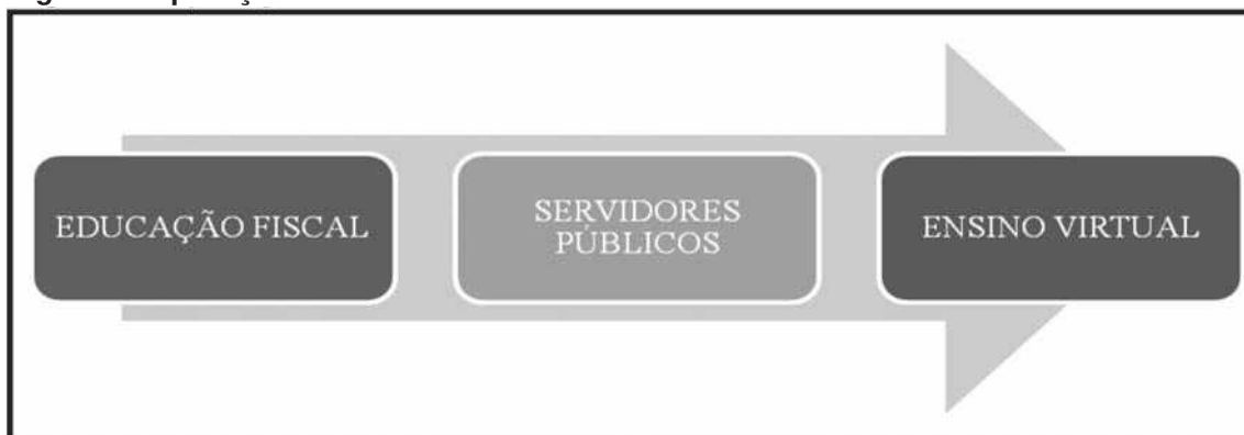
Figura 3 - Aplicação do Ensino Virtual