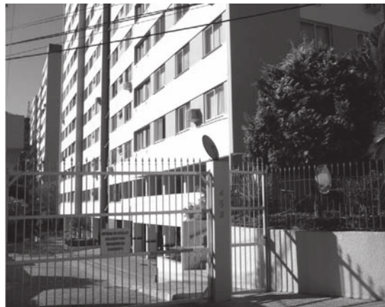
Figura 2 - Visão frontal de condomínio residencial

Atualmente, o condomínio mantém nove funcionários efetivos, sendo: duas funcionárias encarregadas da limpeza dos blocos; cinco porteiros trabalhando com revezamento de turno; um zelador e um funcionário específico para a limpeza das folhas caídas no chão e separação do lixo reciclável. Além disso, uma empresa terceirizada presta serviços de jardinagem.