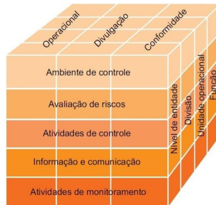
Figura 1 Cubo COSO – Relação entre Componentes, Objetivos e Estrutura Organizacional