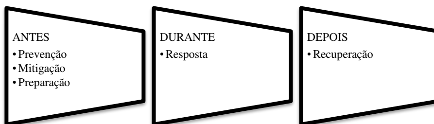
Figura 2. Classificação de custos para gestão de riscos e acidentes de trabalho

Sugere-se que inicialmente se reconheça uma nova estrutura e classificação dos custos. A literatura propõe classificar em custos diretos versus custos indiretos, ou em custos segurados versus custos não segurados, ou ainda em custos da prevenção versus custos de acidente. Considerando os distintos momentos em que podem e devem incidir custos, para evitar o acidente, ou minimizar seus efeitos, ou ainda preparar a equipe para a resposta e recuperação quando da ocorrência do acidente, propõem-se uma nova classificação, para o processo de gerenciamento de riscos de acidentes de trabalho mais ampla. A Figura 2 representa a nova classificação proposta por esta pesquisa, considerando que os custos podem ocorrer em três momentos distintos em relação ao acidente: antes; durante e depois.