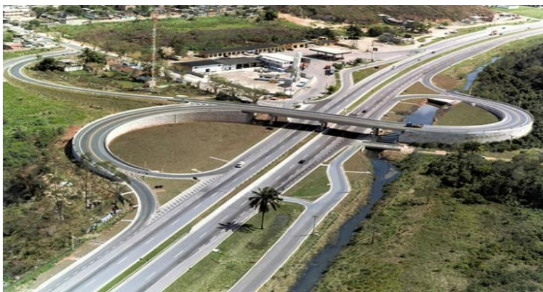
Figura 1. Imagens da infraestrutura rodoviária da companhia

A companhia administra os 142,5 quilômetros da Rodovia Santos Dumont (BR-116/RJ), no estado do Rio de Janeiro, e é responsável pela recuperação, operação, manutenção, monitoração, conservação, implantação de melhorias e ampliação do sistema rodoviário, além de disponibilizar serviços aos usuários da rodovia. A companhia possui 920 colaboradores, sendo 370 funcionários que, em sua maioria, são moradores dos municípios da região atendida pela rodovia.