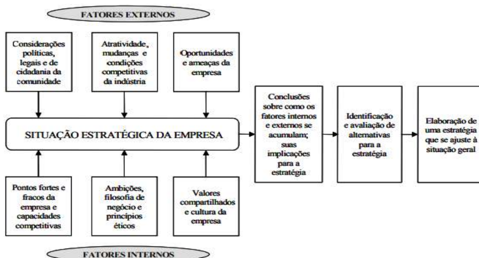
Figura 1. Fatores que moldam a estratégia organizacional

Assim, tanto as necessidades do mercado quanto as habilidades internas fazem com que prestadoras de serviços formulem suas estratégias com base em suas forças e oportunidades de atuação. A Figura 1 apresenta o mecanismo para o desenvolvimento das estratégias, por meio do mesmo raciocínio.