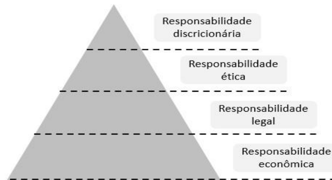
Figura 1 Pirâmide de Responsabilidade Social Corporativa