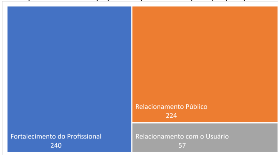
Figura 3 Mapa de árvore - Espaços de Oportunidade para proposição das ideias